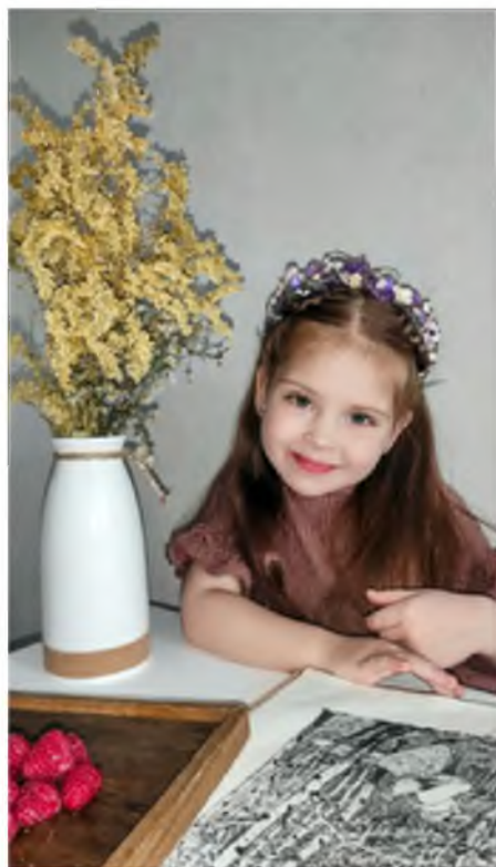
Фото работа «Нежность»

КРОО ПСП «Дошкольник» г. Красноярск, ул. Академгородок 30-21, e-mail: doshkolnik@list.ru